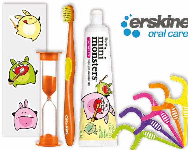
FOTO INDICATIVA, LA CONFEZIONE PUÒ VARIARE IN BASE A QUANTO FORNITO DAL PRODUTTORE